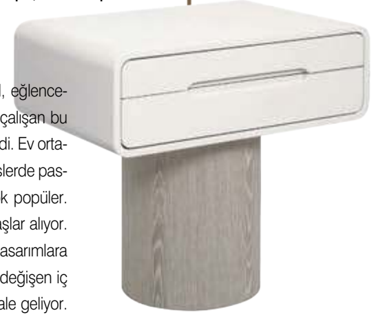
"Koh Samui" yan sehpa, ModShop.