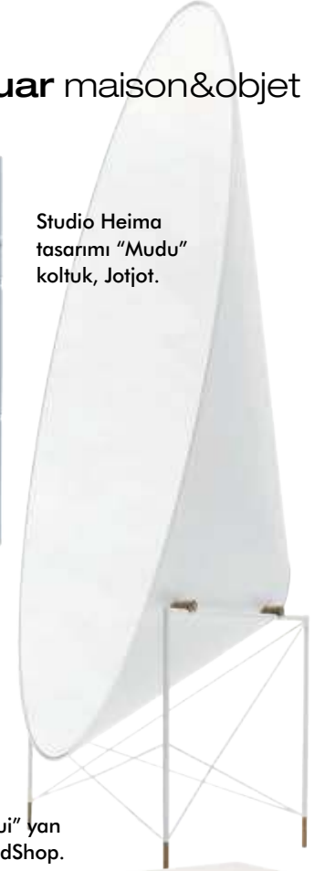
Studio Heima tasarımı "Mudu" koltuk, Jotjot.