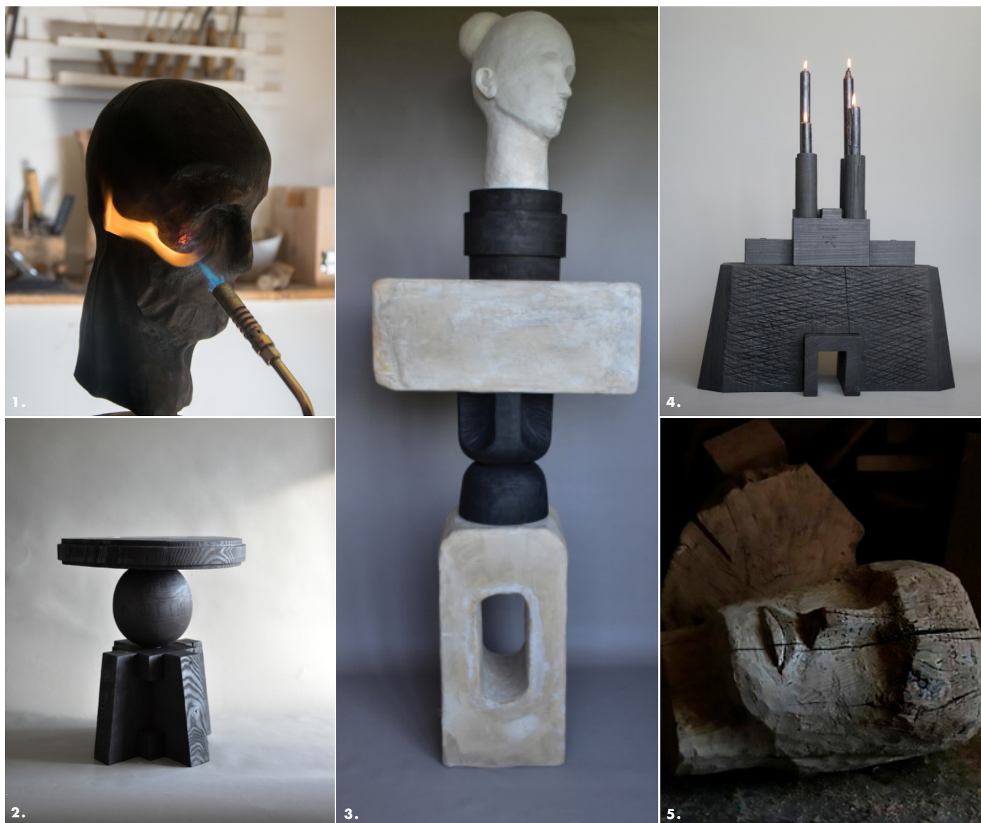
1. «Tête» en noyer sculpté, brûlée au chalumeau. 2. L'assemblage de géométries élémentaires compose les formes d'un guéridon en frêne et noyer brûlés. 3. Figure totémique, le socle devient sculpture. La colonne de «L'Amoureuse» alterne béton et bois d'amandier calciné. La tête est en terre cuite blanche. 4. Entre bougeoir et architecture, «Le Temple de Luc». 5. De la souche de bois mort ramassée en forêt à la sculpture, des gestes archaïques taillent le peuplier dans la masse et font jaillir une expression.

Dans le respect de la nature qui l'entoure, Christian Caulas puise sa force. À partir d'une pièce de bois, il imagine une scénographie qui engage le corps dans un geste radical et précis. Une puissance instinctive l'anime pour composer ses architectures aux formes pures ou l'expression recueillie d'un visage sculpté. Dans les pièces qui affichent un usage, la question du design est pour lui secondaire. En toute simplicité, il préfère dire : « pour moi, le design n'existe pas ». Tout au plus distingue-t-il certaines de ses sculptures comme étant fonctionnelles et d'autres pas. Car chaque pièce unique est construite et « un bougeoir sans bougie, par exemple, n'est ni plus ni moins qu'une sculpture ». Entouré de montagnes, dans un hameau isolé des Alpes-de-Haute-Provence où les hivers sont rudes, « ce qui compte c'est le bois et les matériaux naturels tout autour de moi. Tout ce que je peux trouver me donne envie de travailler et inspire un sentiment ». La densité de la forêt domaniale du Jabron est donc une respiration autant qu'une source d'inspiration pour engager un travail instinctif et empirique. Dans l'atelier, où il dessine peu, ce sont les formes qui viennent à lui. La matière calcinée a une aura particulière. Sous la flamme, elle devient une